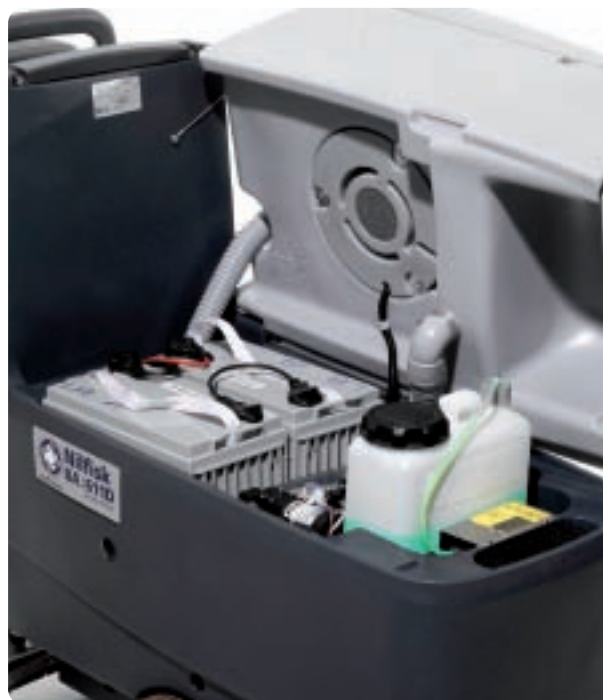
Likavesisäiliön kallistaminen helpottaa puhdistusta ja pääsyä akkuihin ja EDS - ECO Dosage Solutioniin