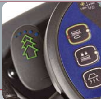
Yksi vipu säätelee Ecoflex-toimintoa