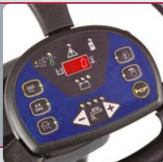
Uusi ergonominen ohjauspyörä, johon on yhdistetty kaikki toiminnot