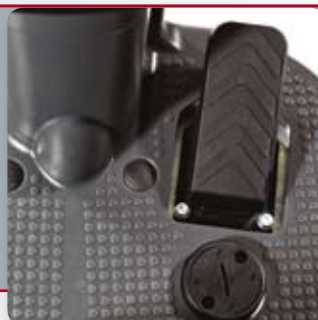
Poljin on mahdollista säätää täysin käyttäjän mukaan siten, että ajoasento on mahdollisimman mukava ja ergonominen